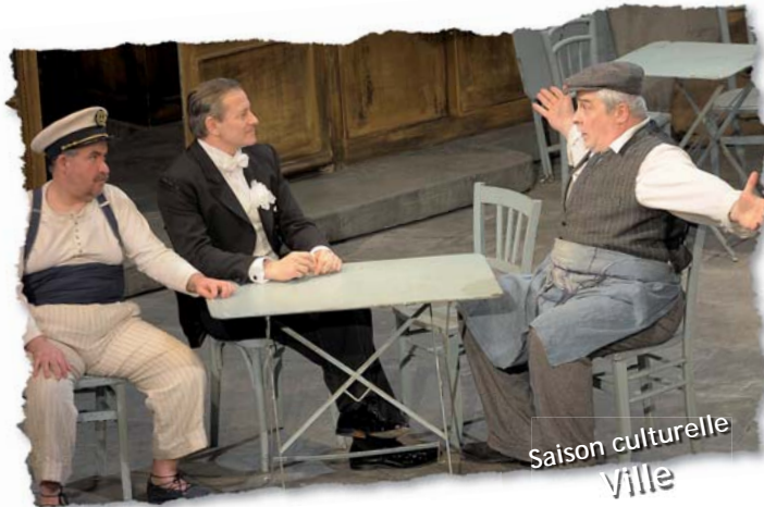
Costume Micro Maglioca

Un vrai régal, pour toutes les générations.