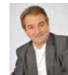
Jean-Michel LALÈRE, Maire de Fontenay-le-Comte