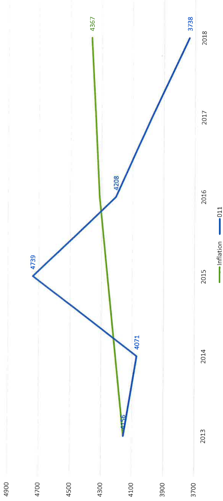
Evolution du chapitre 011