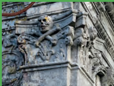
Décor macabre d'une chapelle du cimetière Notre-Dame