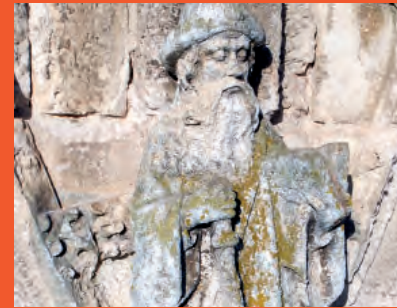
Statue de l'apôtre saint Jacques et ses attributs de pèlerin, ornant le clocher de l'église Notre-Dame