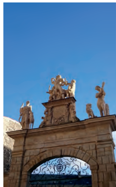
Laocöon (copie de la sculpture du Vatican) rue du Pont-aux-Chèvres