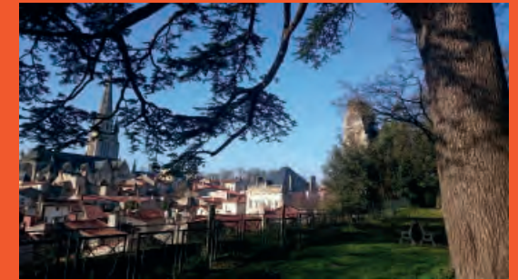
Panorama sur la ville : vue du Parc Baron