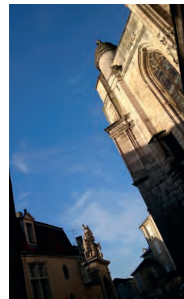
Chevet de l'église Notre-Dame, rue Notre-Dame