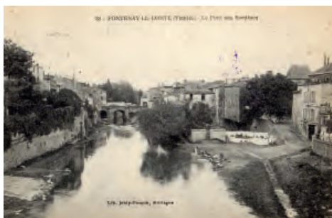
Le pont des Sardines depuis le pont Neuf