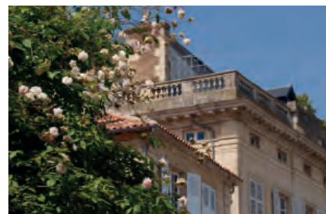
L'hôtel Lespinay de Beaumont (18 e siècle)