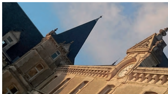
Ancien collège Viète, actuelle École de Musique et de Danse, rue Rabelais