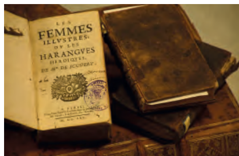
Ouvrages du fonds ancien de la Médiathèque