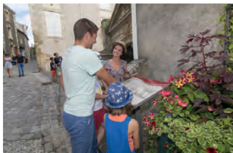
Promenade-découverte en suivant les panneaux de signalétique patrimoniale