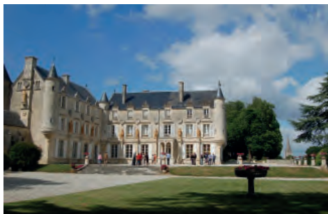
Château de Terre-Neuve