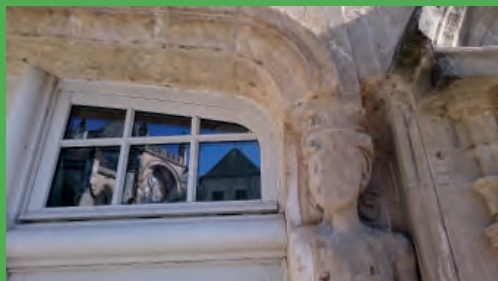
Reflet et caryatide, rue Gaston Guillemet