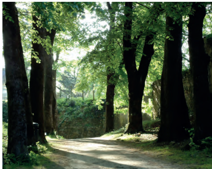
Le Parc Baron, jardin public arboré sur les vestiges de la forteresse médiévale