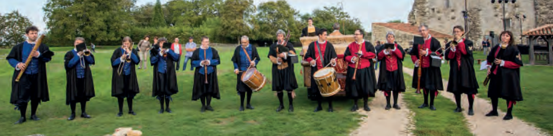
La Compagnie Outre Mesure, musiciens spécialisés dans la musique Renaissance et baroque (16 e et 17 e siècles)