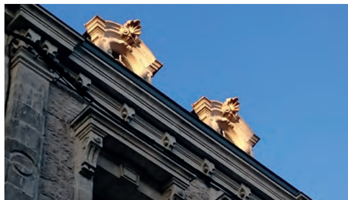
Lumière du soir, rue de la République