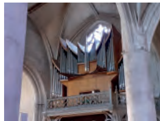
Orgue Marie Reine du Ciel dans l'église Notre-Dame