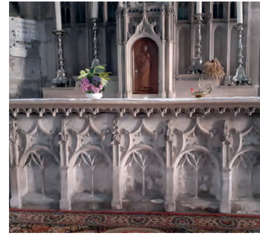
Retable dans l'église Notre-Dame dessiné par Octave de Rochebrune (19 e s.)