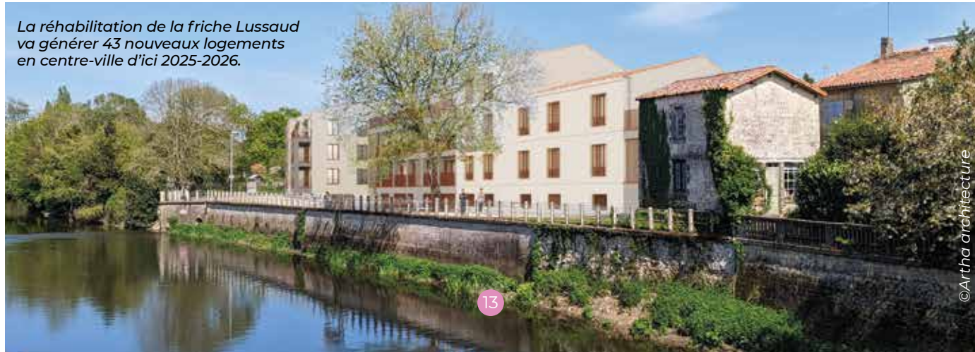
La réhabilitation de la friche Lussaud va générer 43 nouveaux logements en centre-ville d'ici 2025-2026.