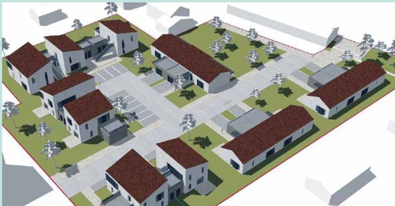
Perspective de la future résidence sur le site de l'ancienne école Marceau Bretaud ©DGA.