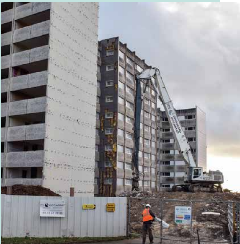
Le grignotage des bâtiments F, G, H a commencé. En 2024 les 127 logements auront totalement disparu du quartier.

Une page importante de l'histoire du quartier se tourne, non sans une certaine émotion notamment pour ceux qui ont participé à la construction du quartier dans les années 70 ou qui ont eu l'occasion d'habiter ces tours. Selon l'entreprise du chantier de démolition devrait durer jusqu'à fin janvier, date où les 127 logements auront totalement disparu du quartier. Les gravas générés par la démolition sont triés et valorisés au fur et à mesure. Le terrain ainsi mis à nu servira de stationnement temporaire permettant de réaliser les rénovations des pieds d'immeuble des bâtiments conservés. Il accueillera ensuite un équipement en cours de définition. L'aménagement d'une coulée verte débutera au cours de l'année 2024 afin de repenser les déplacements au sein du quartier. Le programme du PRIR (programme de renouvellement urbain d'Intérêt Régional) des Moulins Liot est en route, il prévoit la reconstruction de 55 logements locatifs par Vendée Habitat, répartis sur trois sites de la ville ; Marceau Bretaud (les 20 logements précisés ci-dessus), Sainte Catherine des Loges (10 logements) et le futur quartier vert (20 logements). Ainsi que 40 logements en accession, et 30 logements par Vendée logement. L'objectif étant de rééquilibrer la répartition des logements et favoriser ainsi la mixité sociale sur l'ensemble du territoire de la commune de Fontenay-le-Comte.