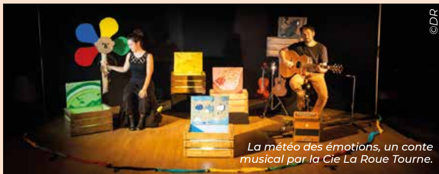
La météo des émotions, un conte musical par la Cie La Roue Tourne.

i Office de Tourisme Vendée Grand Sud Place de Verdun à Fontenay-le-Comte : 02 51 69 44 99 fontenay-vendee-tourisme.com