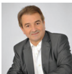
Jean-Michel LALÈRE Maire de Fontenay-le-Comte du 4 avril 2014 au 3 juillet 2020

Je pars serein car l'avenir est entre de bonnes mains.