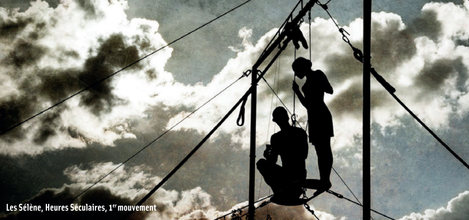
Les Sélène, Heures Séculaires, 1 er mouvement