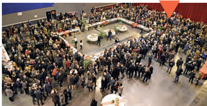
Photo de clôture, avec les Sages, le Conseil municipal d'Enfants et les élus du Conseil municipal. Plus de 700 invités sont venus assister à la cérémonie puis ont partagé buffet et verre de l'amitié dans la Grande Halle.